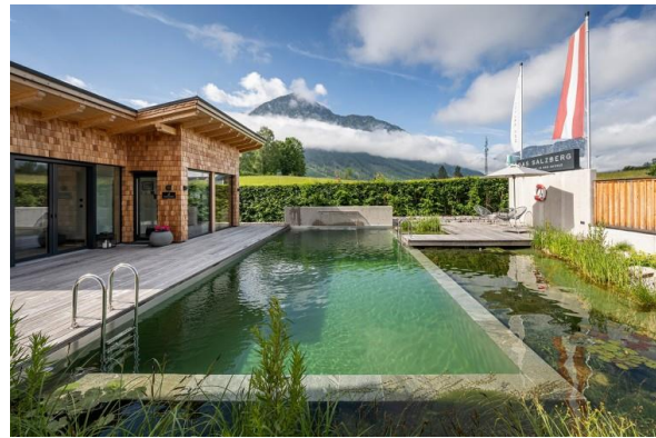
Slika 1. Prirodni bazen (Biotop, 2024)

Nadalje, zone u prirodnim bazenima mogu biti podijeljene na tri načina (slika 2). Prvi način je da su i zona za regeneraciju i zona za plivanje u jednom dijelu. Drugi način jest da je jedan dio zone za regeneraciju u sklopu zone za plivanje, a drugi dio se nalazi potpuno odvojen od zone za plivanje. Treći način je onaj u kojem je zona za regeneraciju potpuno odvojena od zone za plivanje (Kircher i Thon, 2018).