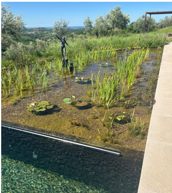
Slika 4. Zona za regeneraciju bazena u Monte Piccolu

Bazen u Monte Piccolu B&B koristi biološku filtraciju vode putem biljnog sustava, a bazen je okružen autohtonim biljkama, starim maslinama i mediteranskim raslinjem (slika 4). Cijeli projekt temelji se na principima ekološke gradnje i smanjenog utjecaja na okoliš: korištenje lokalnih materijala, minimalna invazivnost na teren, sakupljanje kišnice i vlastita proizvodnja hrane iz vrta.