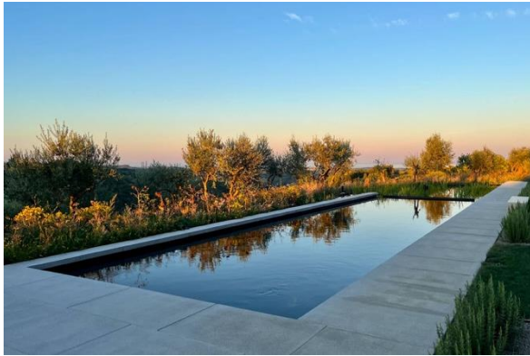
Slika 3. Prirodni bazen u Monte Piccolu (Marinić, 2024).

se savršeno uklapa u okoliš i vizualno nadopunjuje krajolik (Contour Architecten, 2022).